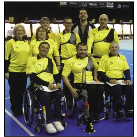
Els tiradors olesans