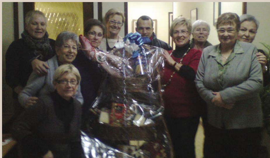
La guanyadora de la Panera