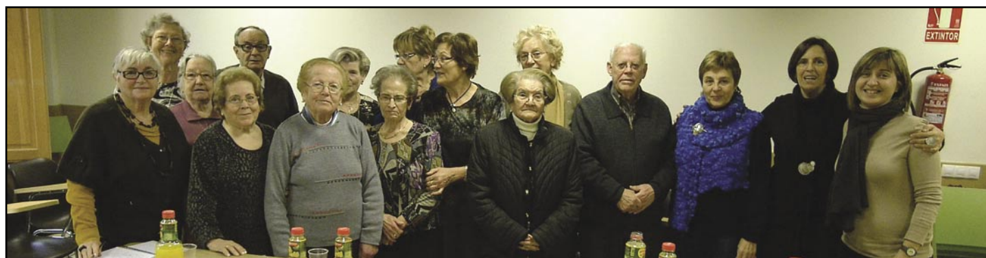
Cloenda del taller