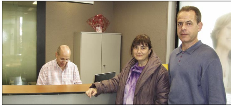
Diners per a La Marató

Quinze persones a Olesa es van beneficiar dels nous plans d'ocupació finançats per la Generalitat i gestionats pel Departament de Promoció Econòmica de l'Ajuntament. Afortunadament, tots els projectes presentats per l'Ajuntament en la darrera convocatòria de plans d'ocupació van ser aprovats, i per tant, s'han pogut contractar quinze persones per a diferents departaments i per a diverses tasques: peons de brigada i peons forestals, un conductor per al bus social i agents de la Via Pública. Aquests quinze persones ja van començar