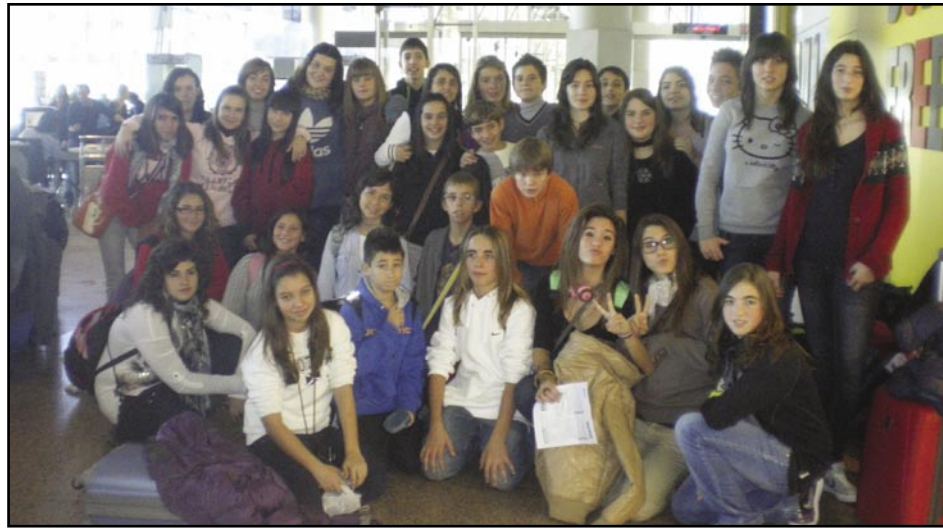
D'Olesa a Paignton

Dies enrere em vaig trobar indisposat a mig dia, vaig anar, com feia si se'm donava la necessitat, al CAP Olesa, i em varen dir que ja no existia el servei d'atenció continuada. Que m'havia d'esperar a que el metge hem pogués visitar (5 dies) o que ja em telefonaria el metge (el que jo tinc assignat). Com a opcions em van dir que esperés al servei d'urgències (de 20 a 24 h) o que em desplaçés a Martorell. En resum: han enganyat a la ciutadania en que tan sols trien el servei d'urgències nocturn, ja que també ens han tret el servei d'urgències diürns. Pregunta a tot ciutadà amb seny: Vostè posaria a una guineu a vigilar les gallines? Si vostè creu que sí, no perdi l'oportunitat de presentar-se a les properes eleccions per President de La Generalitat, ja que és el que ha fet el senyor Mas: posar a una guineu a cura de les gallines. Evidentment la guineu es