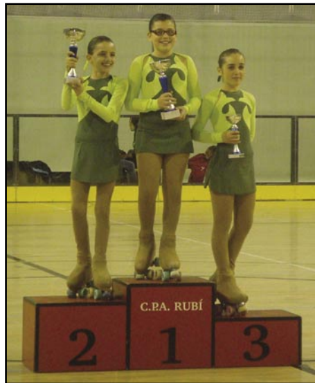
Les guanyadores de Preiniciació D

El passat 8 de gener es va dur a terme el Torneig de Reis Decofusta per a nens i nenes. Van participar un total de 20 parelles d'entre 6 i 12 anys, en 4 grups segons el seu nivell. Aquí estan els guanyadors. Enhorabona!