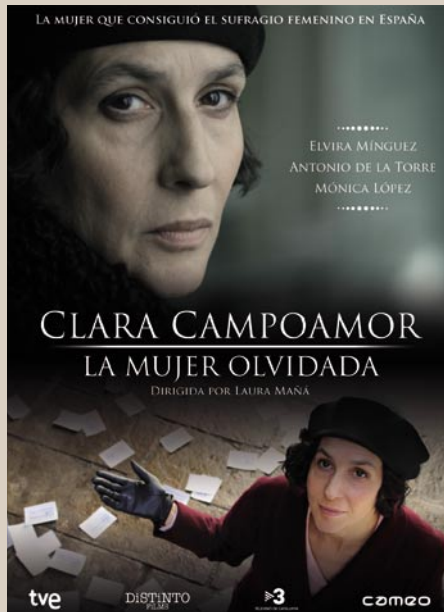
Una producció olesansa candidata