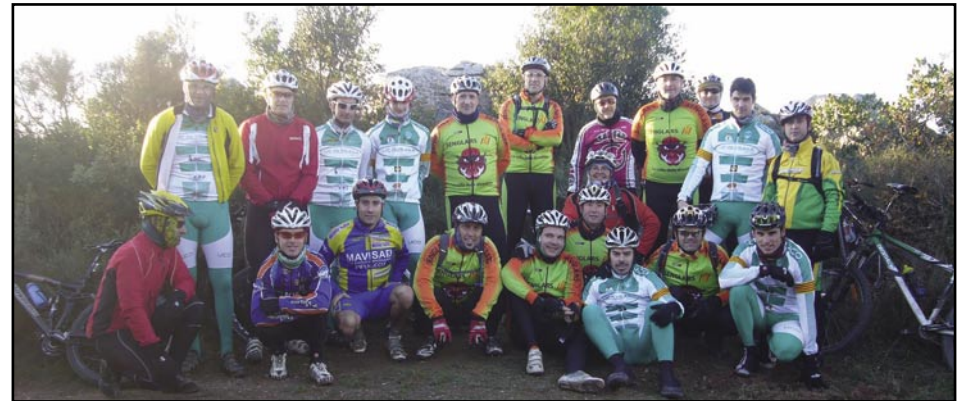
Cap a la Creu