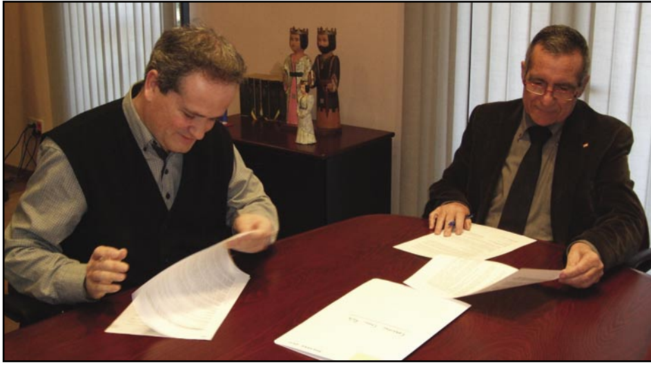
La Creu Roja torna a Olesa