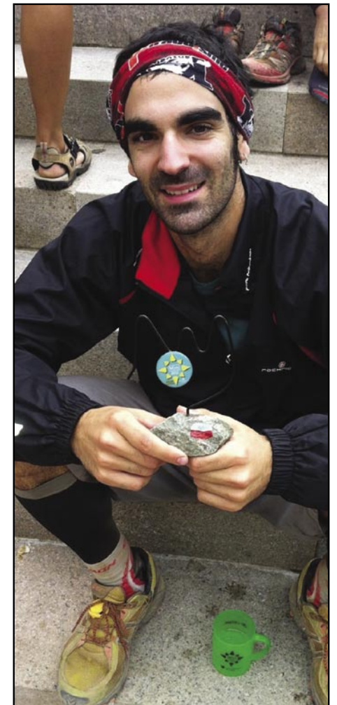
Cansat però feliç