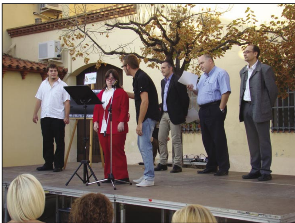
25 anys de Can Comelles

Això no hagués estat possible sense tots els membres de la colla de Diablots d'Olesa. Una jornada de molt treball per part de tots, però molt gratificant. Una vegada acabada la festa, en veure que tothom ens felicitava, vam creure que la gent ho va gaudir i s'ho va passar genial.