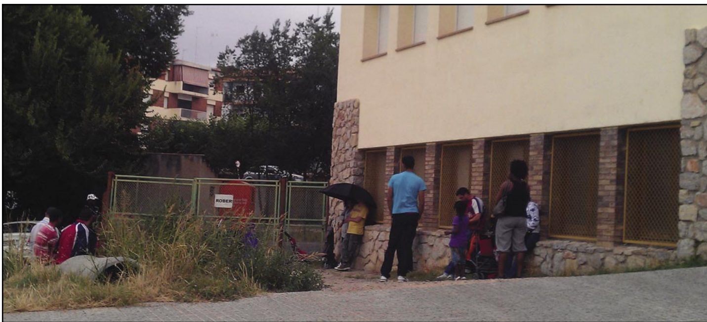
Cues per roba i aliments

El nou projecte consisteix en un magazine de tarda produït per les diferents emissores. Els continguts del programa s'elaboraran conjuntament des d'un consell de redacció del qual Olesa Ràdio en forma part i que, diàriament, es reunirà per debatre, analitzar i programar els continguts de cada programa.