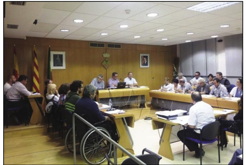
Qüestió de banderes