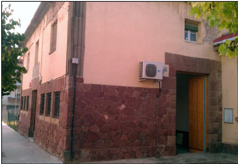
Els veïns de La Rambla, amb nou local

El periòdic 08640 no es fa responsable del contingut de les cartes (opinions, comentaris, rèpliques i suggeriments d'interès general, respectuosos cap a les persones i institucions), i es reserva el dret de publicar-les i resumir-les si és necessari. Els articles que no es publiquen en aquesta edició per falta d'espai, sortiran a les properes edicions. Les cartes per a aquesta secció han de signar-se amb el nom i cognom de l'autor, DNI, telèfon i adreça. S'han d'adreçar al tel: 635 810 173 o a l'a/e: periodic08640@hotmail.com