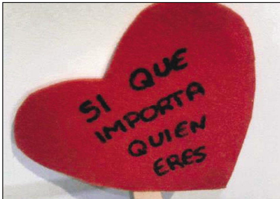
Campanya "del cor"

El Ple de l'Ajuntament va aprovar el passat 27 de setembre una moció que reclama el dret a l'autodeterminació de Catalunya, i que s'adhereix a la resolució del Parlament de Catalunya en la qual es constata la necessitat que