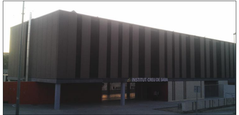
Projecte del Creu de Saba

El projecte va adreçat a alumnes amb manca d'autonomia per causa