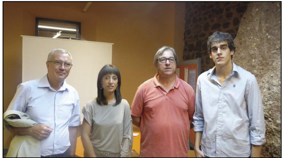
Guia a Vacarisses

La guia, que ha tingut una gran acceptació entre els olesans, presenta 20 itineraris diferents amb informació patrimonial i històrica dels indrets naturals que es proposen visitar, i 12 fotografies panoràmiques amb una