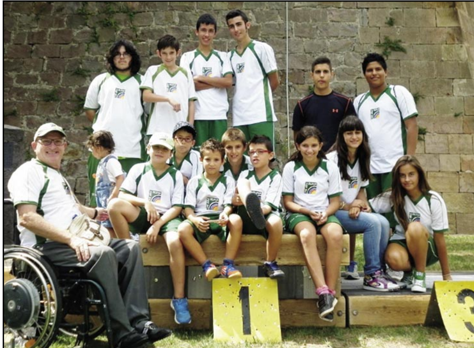
Els joves tiradors olesans

Després que el club anunciés la intenció de fer un primer equip, molts