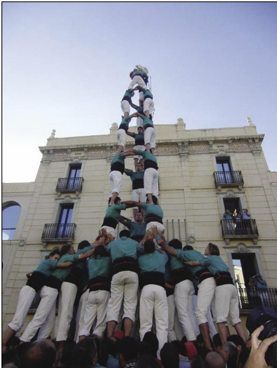
Castellers davant l'Ajuntament